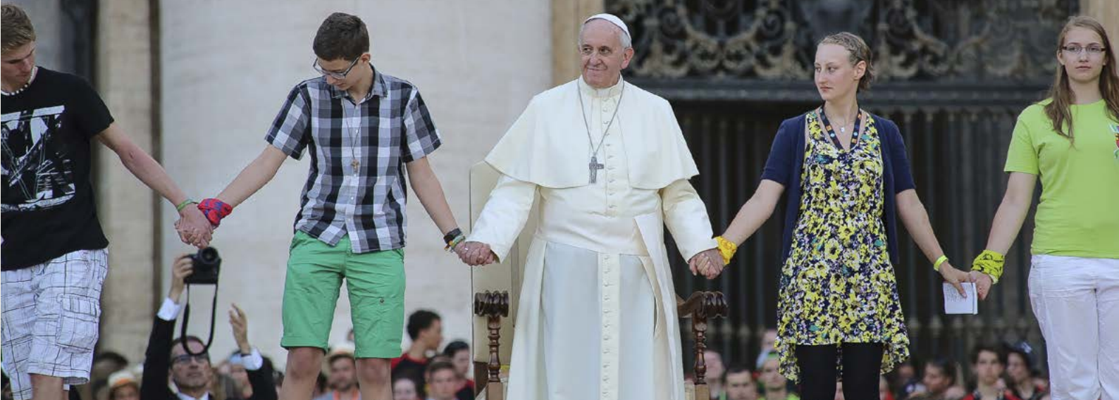
Papst Franziskus mit Jugendlichen bei der Jugendsynode 2018