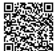
katholisch.de (S. 16/17)