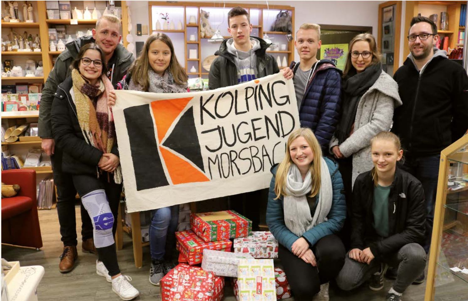
Kolpingjugend Morsbach – Für die Autorin ein Ort, Kirche attraktiv zu gestalten.

den Glauben und sehen persönliche Probleme als bedeutender an.