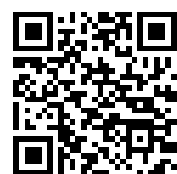
ev. Kirche Oberbantenberg (S. 16/17)