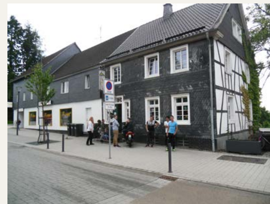
Das Jugendzentrum in Nümbrecht.

Und dies ist eine elementare Aufgabe unserer Gesellschaft: Jungen Menschen Werte zu vermitteln, die wichtig für das Zusammenleben sind und ihnen die Möglichkeit zu geben, sich zu entwickeln. Dabei vermitteln wir den Menschen, die unsere Einrichtung besuchen: »Du bist richtig – So wie du bist.« ■