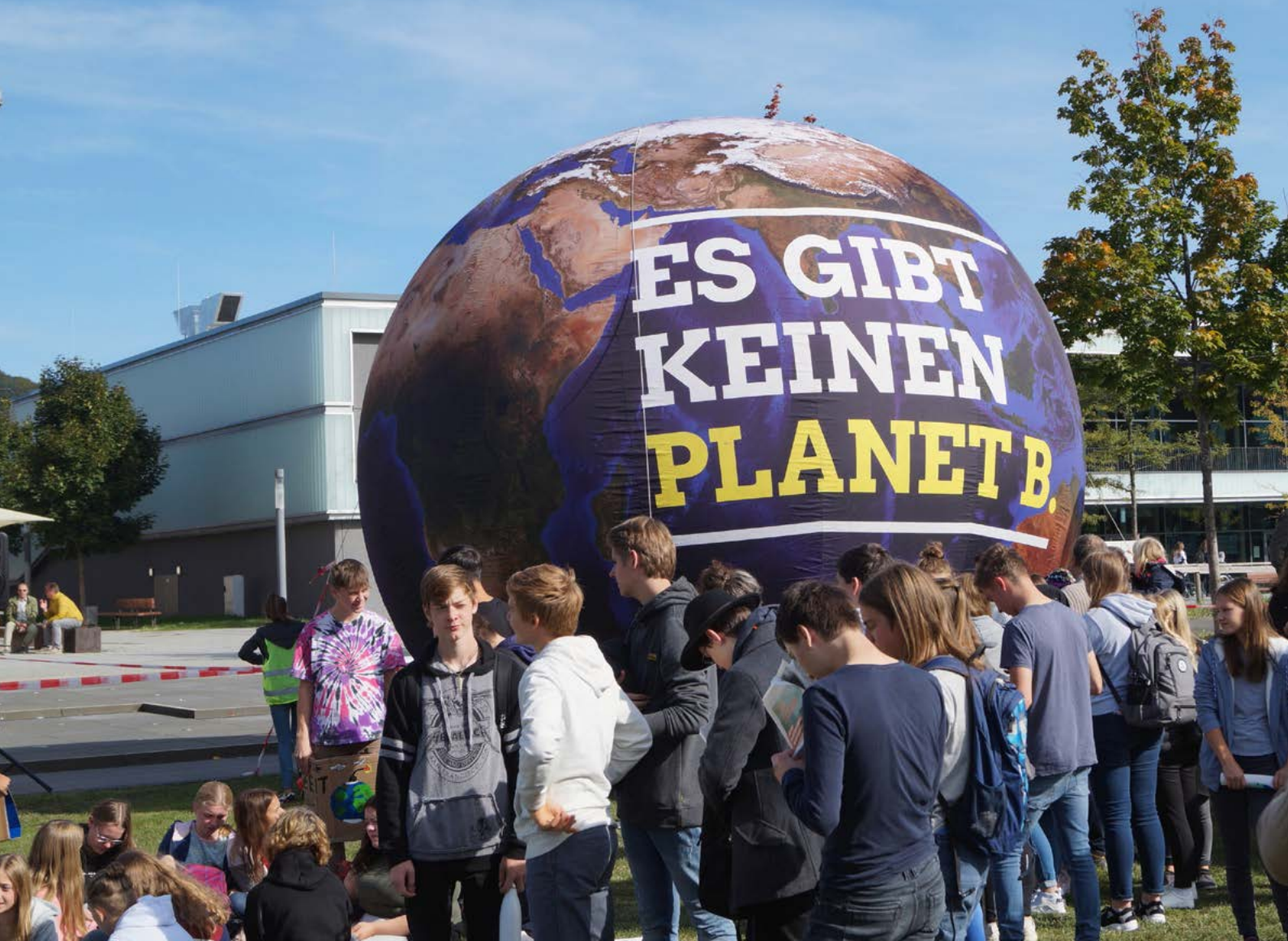
Klimastreik in Gummersbach im September 2019