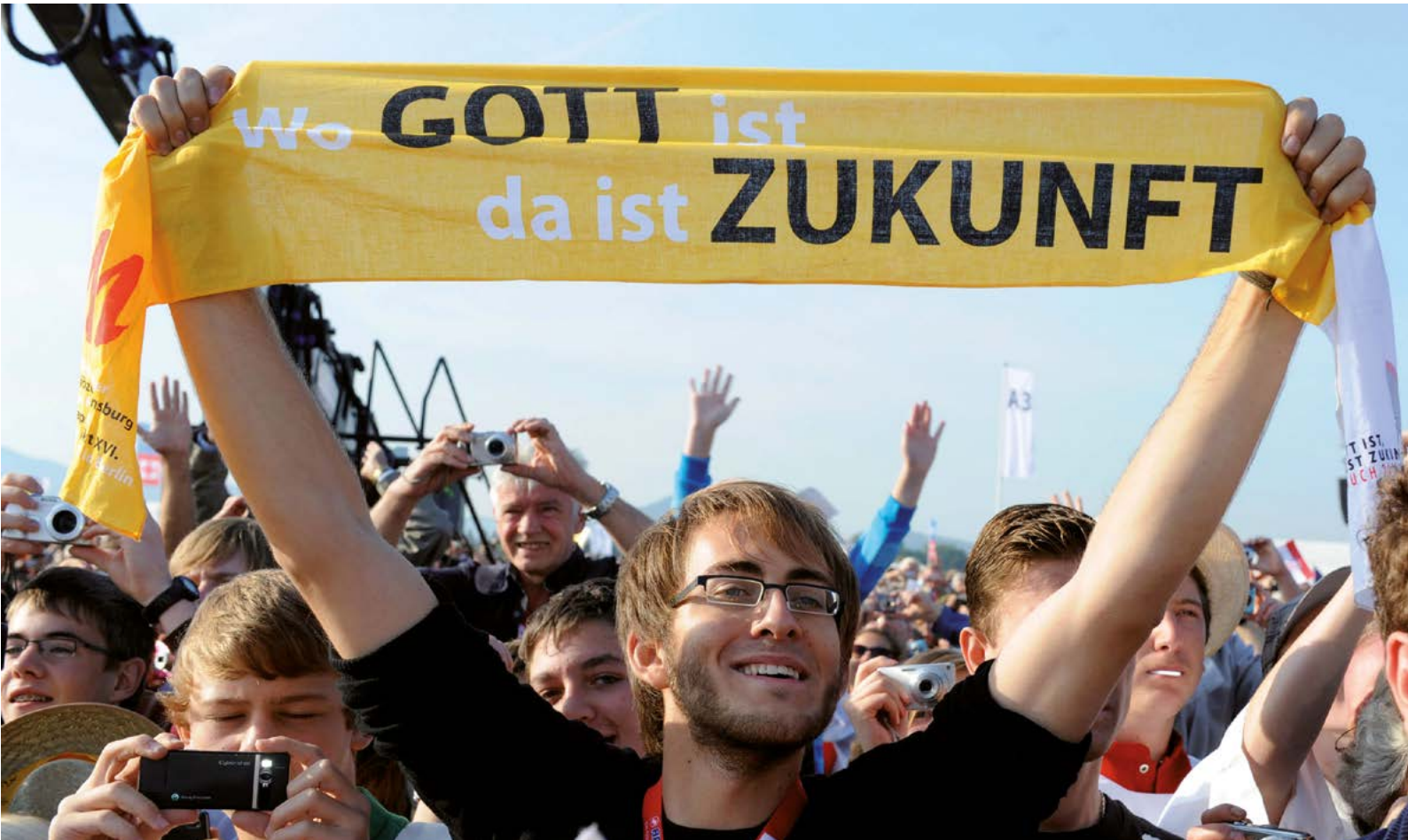
Begeisterter Jubel für Papst Benedikt in Freiburg 2011