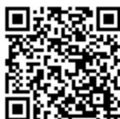
ev. Kirche Wiehl (S. 16/17)