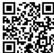
wiewollenwirlieben.de (S. 10/11)