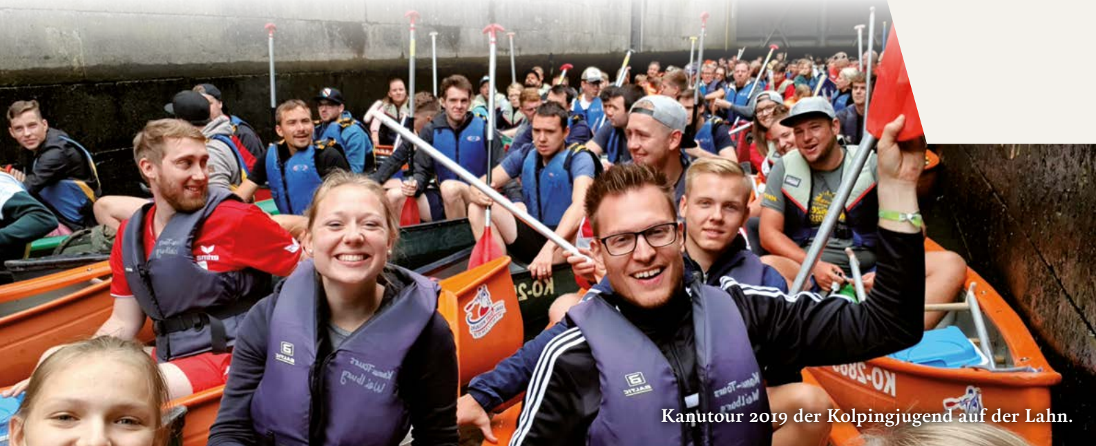
Kanutour 2019 der Kolpingjugend auf der Lahn.

■ In unserer Pfarreiengemeinschaft M-F-W bilden die Messdiener, die Kolpingjugend Morsbach und die Katholische Landjugendbewegung (KLJB) Friesenhagen die Säulen der Kinder- und Jugendarbeit. Sie arbeiten zu einem großen Teil selbstständig und werden durch das Pastoralteam begleitet und unterstützt.