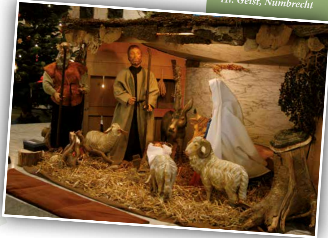
Hl. Geist, Nümbrecht